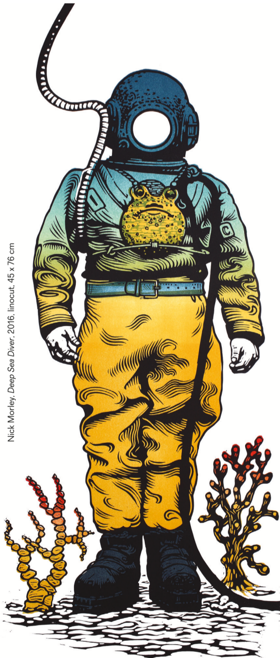
Nick Morley, Deep Sea Diver, 2016, linocut, 45 x 76 cm